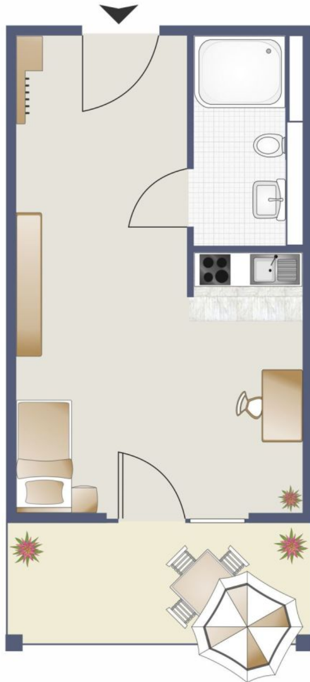
Grundriss Bonner Str. 281, EG

Zimmer: 1,00 Wohnfläche ca.: 23,00 m 2 Kaltmiete: 520,00 EUR (zzgl. Nebenkosten)